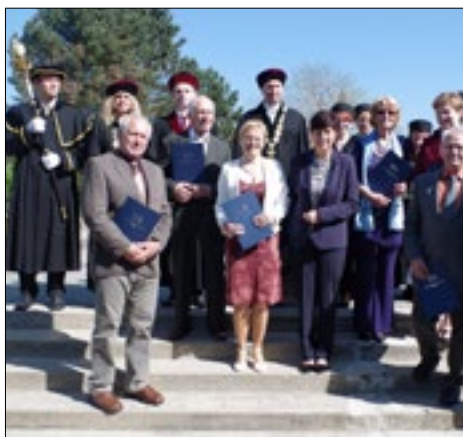
Virtuální promoce U3V-026.