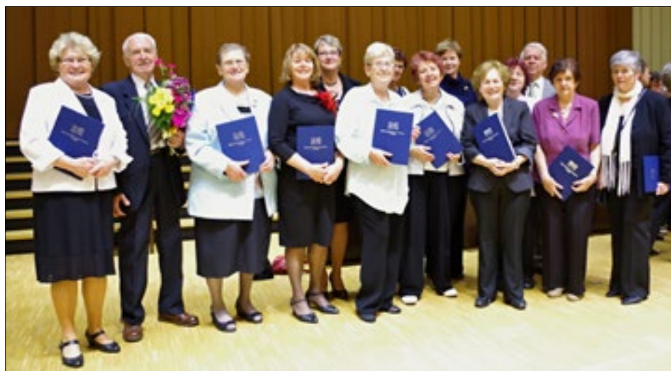
Slavnostní promoce v Praze v aule České zemědělské univerzity - U3V.