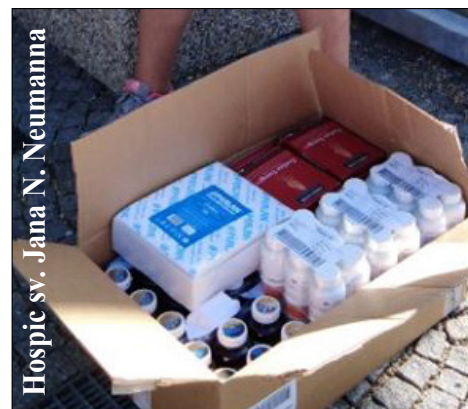
Hospic sv. Jana N. Neumann

HUMANITÁRNÍ POMOC UKRAJINĚ, Z.S. v době nouzového stavu pomáhá lidem bez domova v dočasných centrech v Praze. Není to sice náplní činnosti neziskové organizace, ale nemůžeme být lhostejní k současné situaci. -fb-