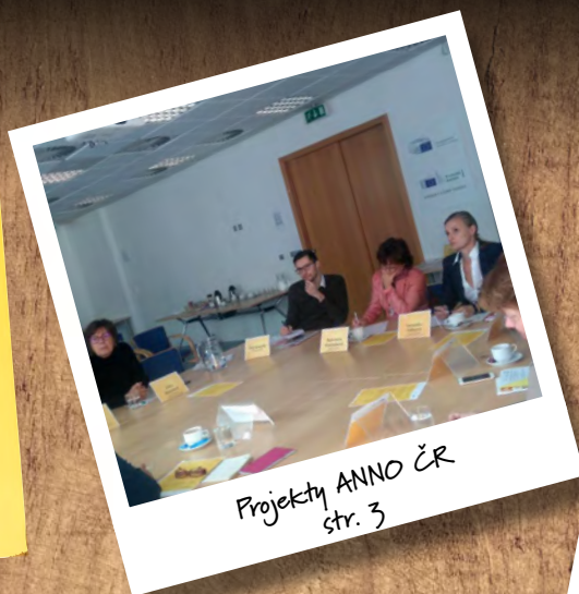
Projekty ANNO ČR str. 3