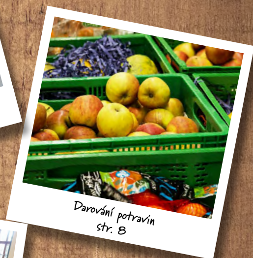
Darování potravin str. 8