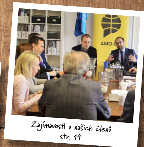
Zajímavosti v našich členů str. 14