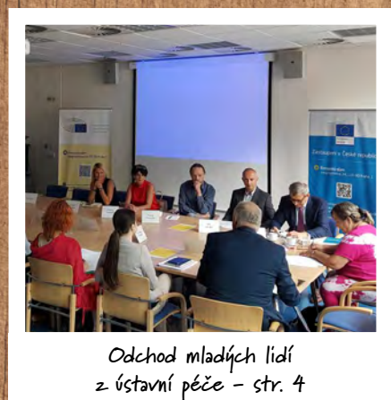
Odchod mladých lidí z ústavní péče – str. 4