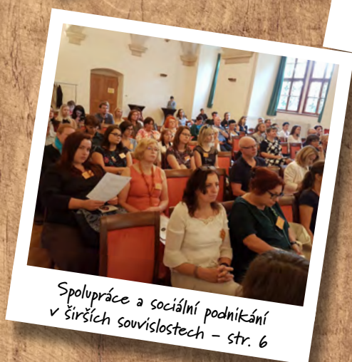
Spolupráce a sociální podnikání v širších souvislostech – str. 6