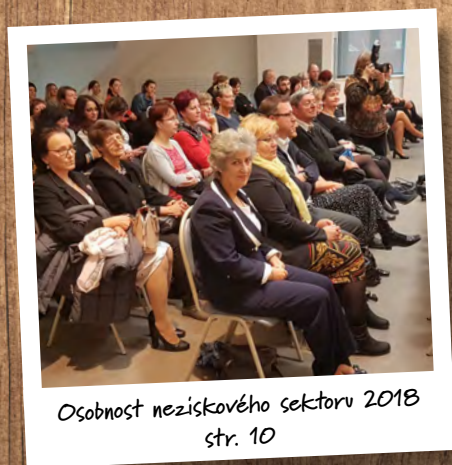
Osobnost neziskového sektoru 2018 str. 10