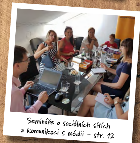
Semináře o sociálních sítích a komunikaci s médii – str. 12